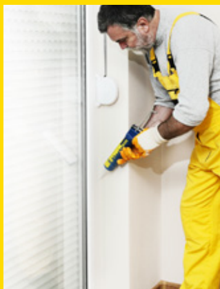
Avec Elastofill, vous pouvez tout rejointoyer