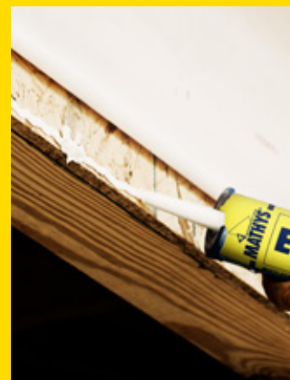
Avec Elastofill, vous pouvez tout coller