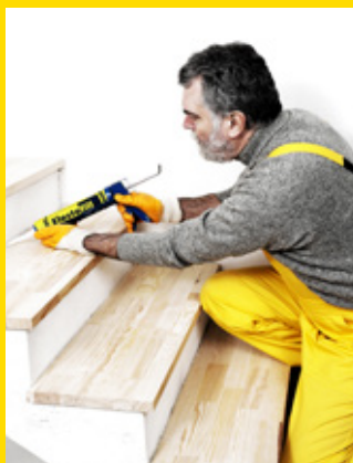
Avec Elastofill, vous pouvez tout colmater