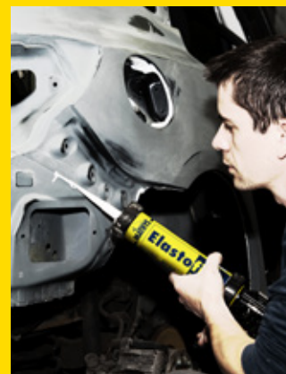
Avec Elastofill, vous pouvez tout reboucher